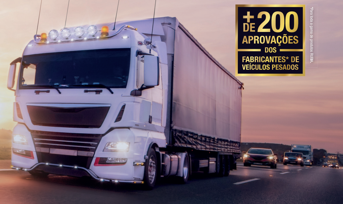
Tabela de aplicação para veículos pesados